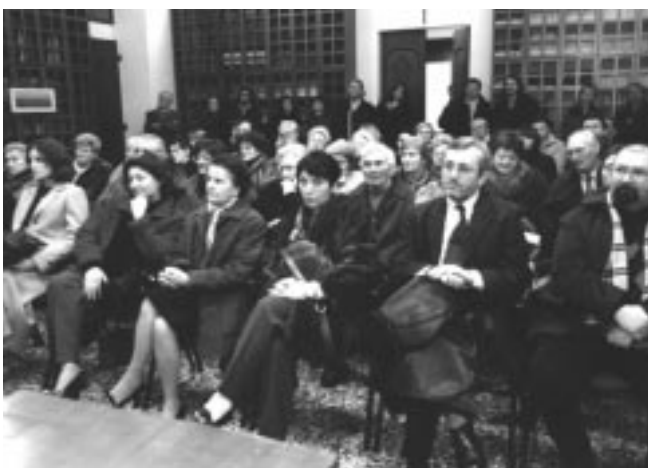
Parte del pubblico alla presentazione del libro Satùl

manzi. Questa è stata l'occasione de Il nome nudo un profondo e intenso romanzo che ruota intorno a un diario, nelle tristi e recenti vicende dell'Ultima Guerra e della Shoah.