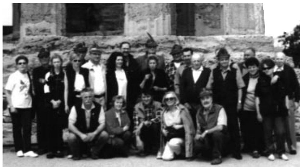
Agrigento, Valle dei Templi