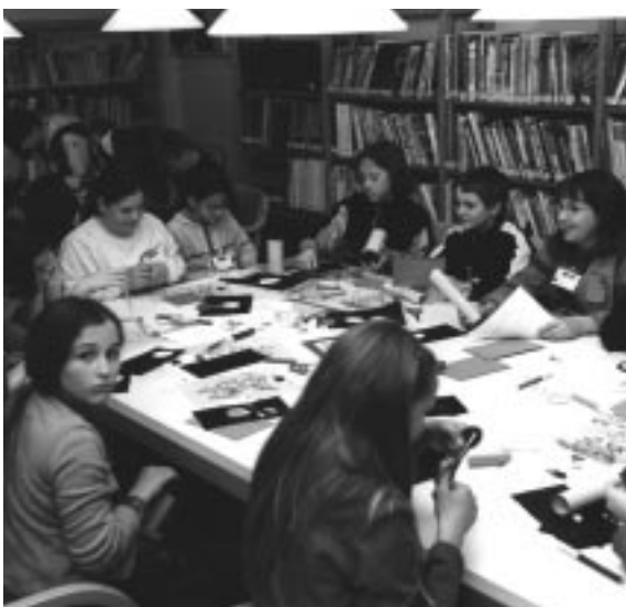
I ragazzi impegnati nella costruzione di un astrolabio