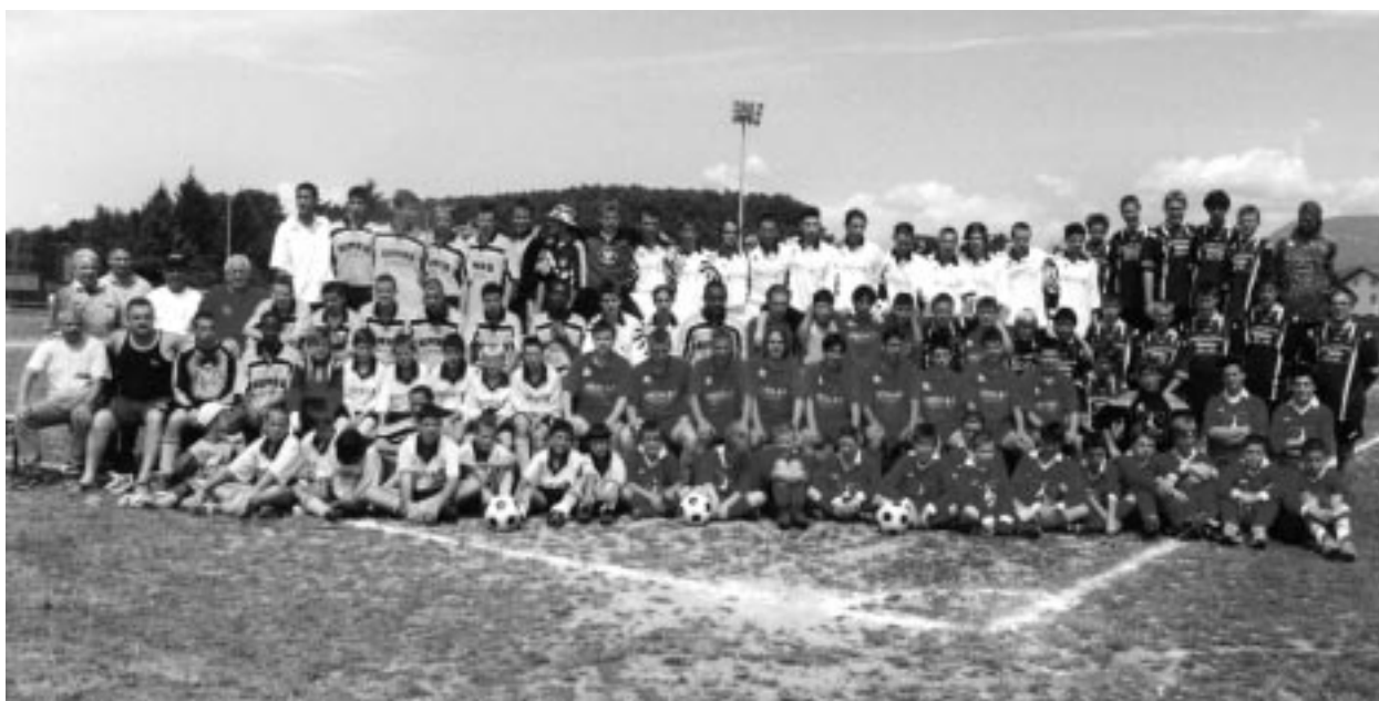
Formazioni calcistiche al completo