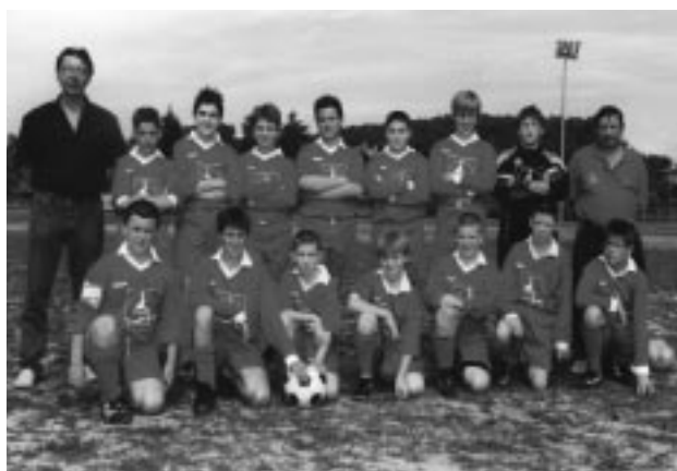
Le nostre due squadre